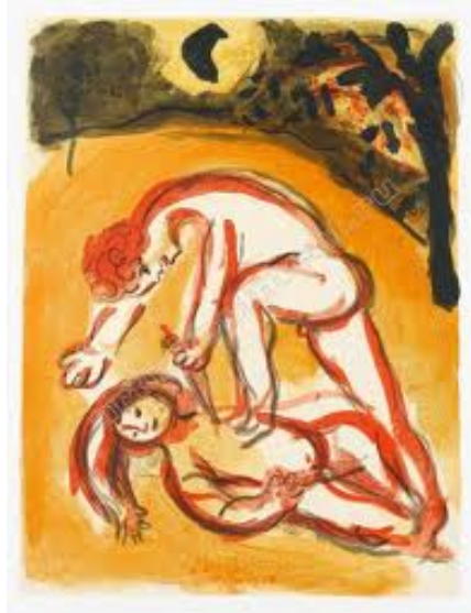
Марк Шагал. Каин и Авель (1960).

Прочитавши, пеняйте на себя и не пинайте меня, ибо предупреждены были!